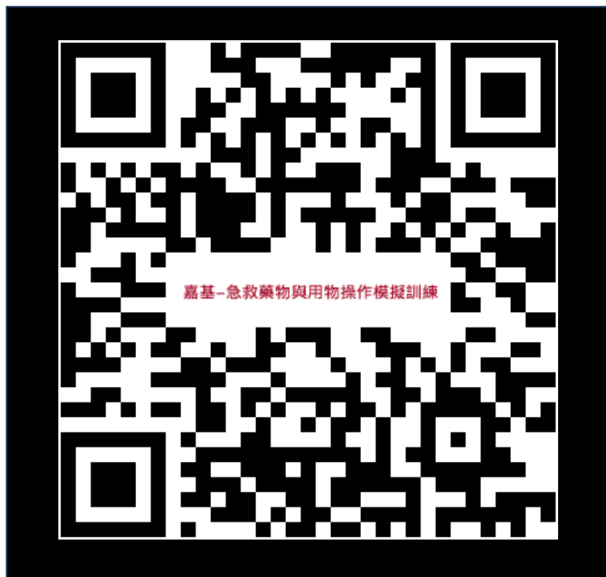
Youtube 連結網站觀看影片